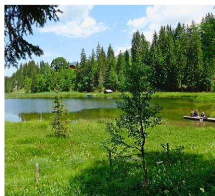
Besungen: Der Lauenensee im Berner Saanenland.